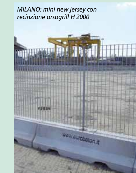
MILANO: mini new jersey con recinzione orsogrill H 2000