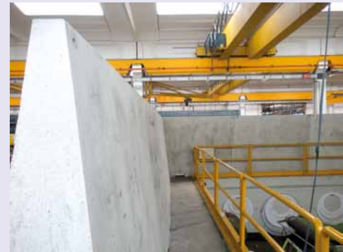
MILANO: Giant uso protezione di fossa di collaudo