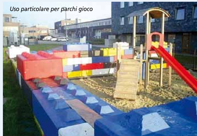
Uso particolare per parchi gioco

scala-blocchi: è il pezzo speciale con inseriti i gradini di calpestio. Ideale per la creazione di scale su terrapieni.