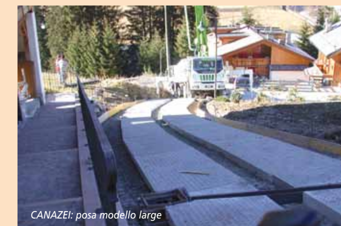
CANAZEI: posa modello large