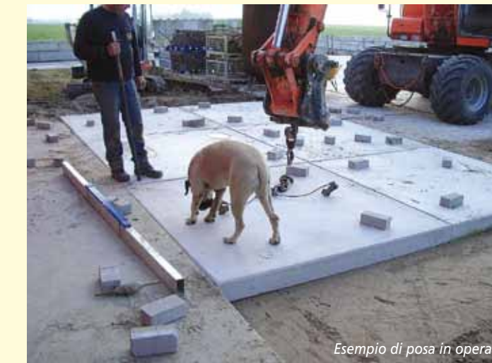
Esempio di posa in opera

Piattaforme in calcestruzzo armato rimovibili con cassette di sollevamento a scomparsa e finitura faccia a vista. Dimensione dei moduli 2000x2000 - h 160