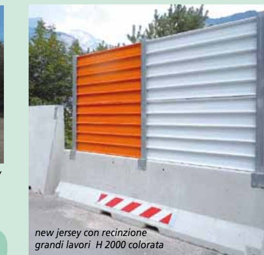
new jersey con recinzione grandi lavori H 2000 colorata