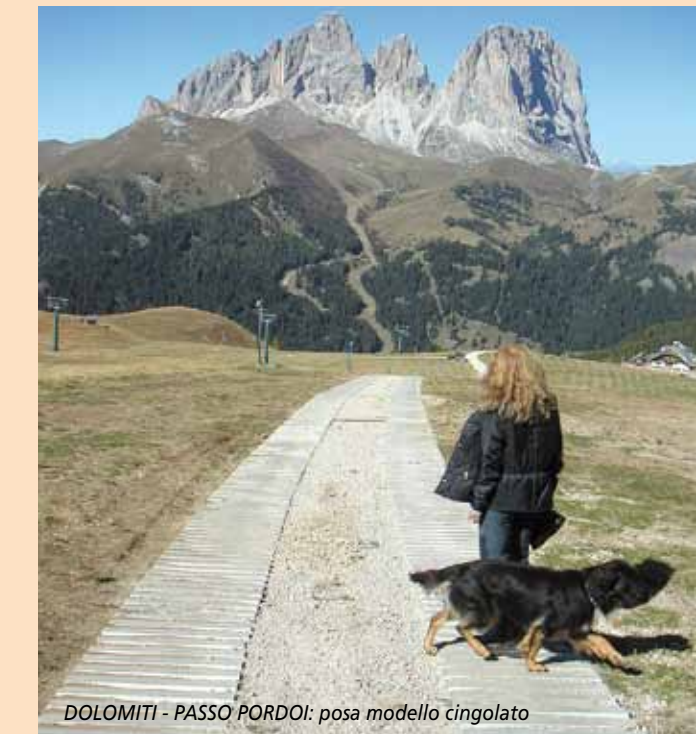
DOLOMITI - PASSO PORDOI: posa modello cingolato

Modelli: cingolato - large - agrario - euro garden