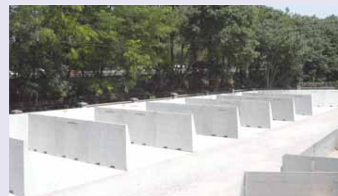
MANTOVA: Big Giant per impianto di riciclaggio GRUPPO TEA AMBIENTE