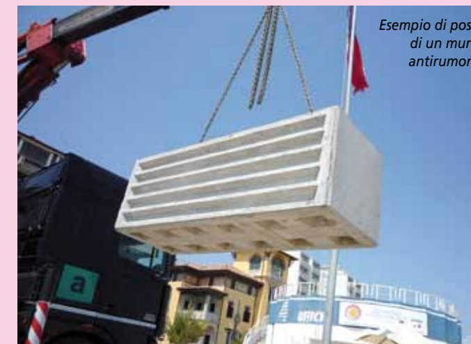
Esempio di posa di un muro antirumore

Di seguito proponiamo 10 idee per il suo utilizzo: