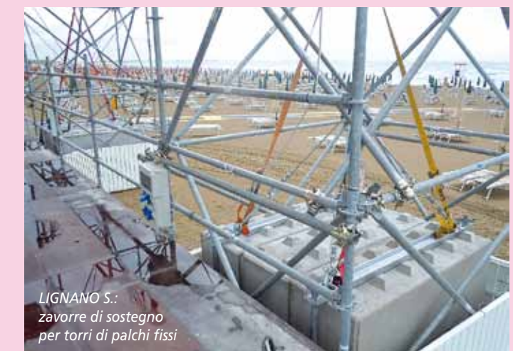
LIGNANO S.: zavorre di sostegno per torri di palchi fissi