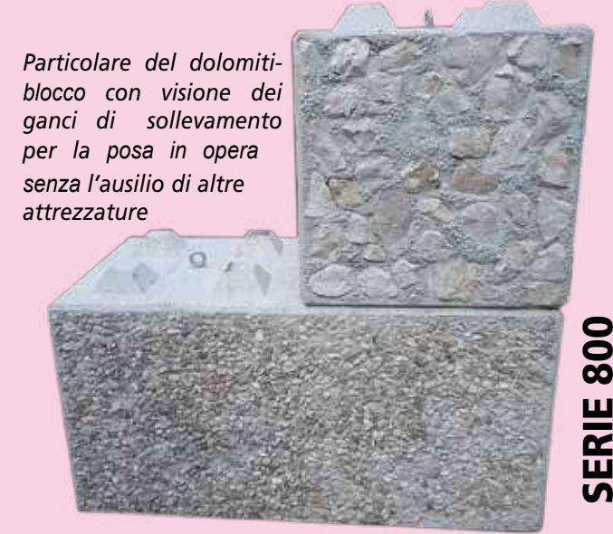
Particolare del dolomiti-blocco con visione dei ganci di sollevamento per la posa in opera senza l'ausilio di altre attrezzature