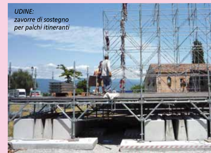
UDINE: zavorre di sostegno per palchi itineranti