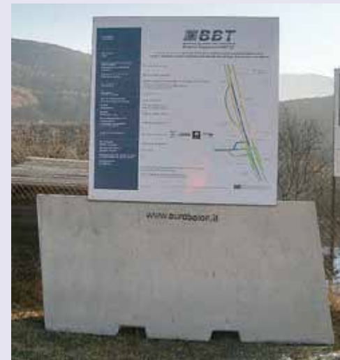
BRENNERO: Giant uso zavorra per segnaletica di cantiere