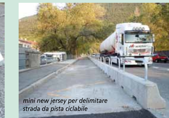
mini new jersey per delimitare strada da pista ciclabile