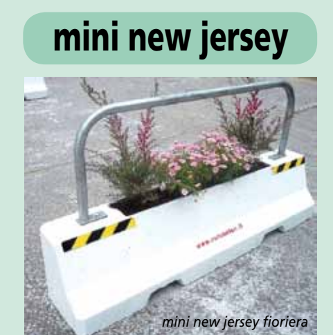
mini new jersey fioriera