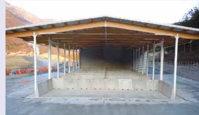
VAL GIUDICARIE: Big Giant per impianto di riciclaggio