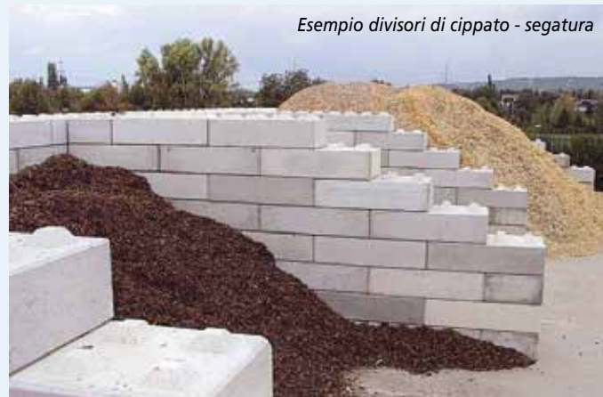
Esempio divisori di cippato - segatura