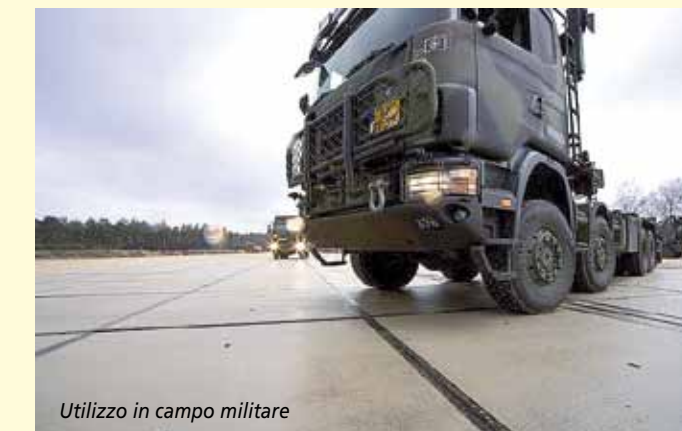
Utilizzo in campo militare