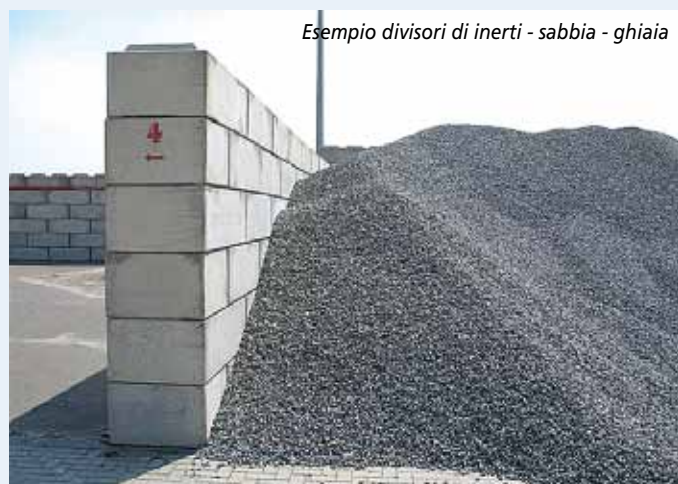
Esempio divisori di inerti - sabbia - ghiaia