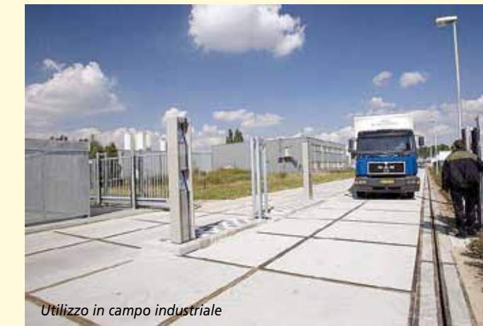
Utilizzo in campo industriale