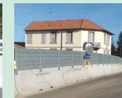
STAZIONE F.F.S. DI SARONNO: new jersey con recinzione grandi lavori H 1000