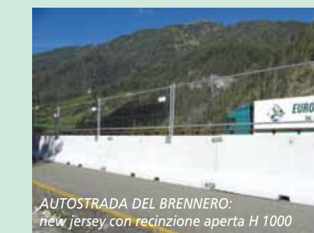
AUTOSTRADA DEL BRENNERO: new jersey con recinzione aperta H 1000