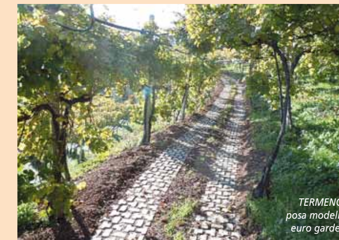
TERMENO: posa modello euro garden