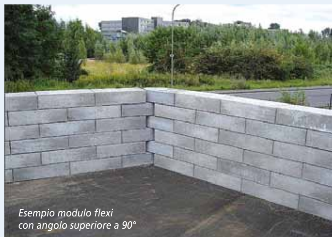
Esempio di parete divisoria per materiali infiammabili