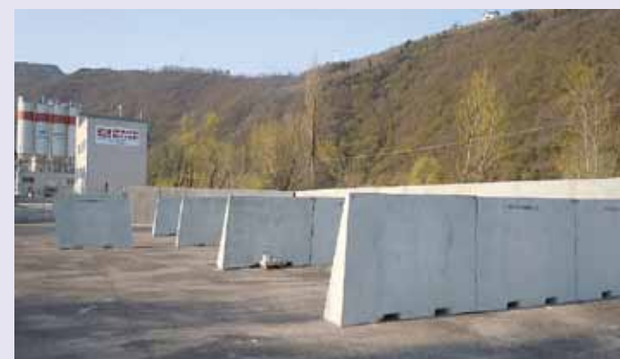
BOLZANO: Big Giant per divisione inerti