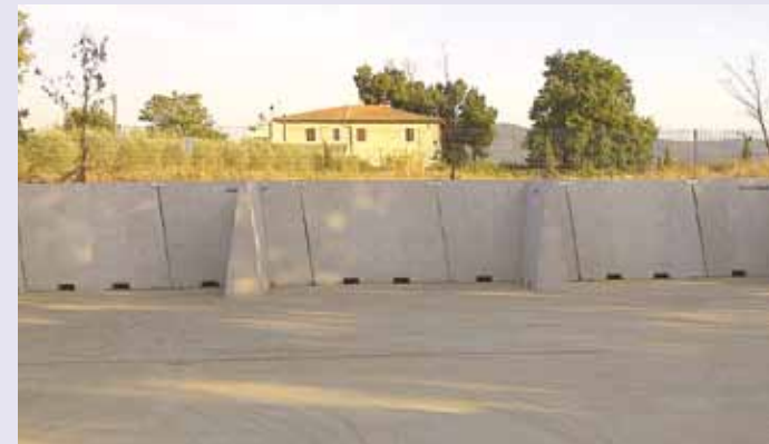
SIENA: Big Giant per divisione materie plastiche